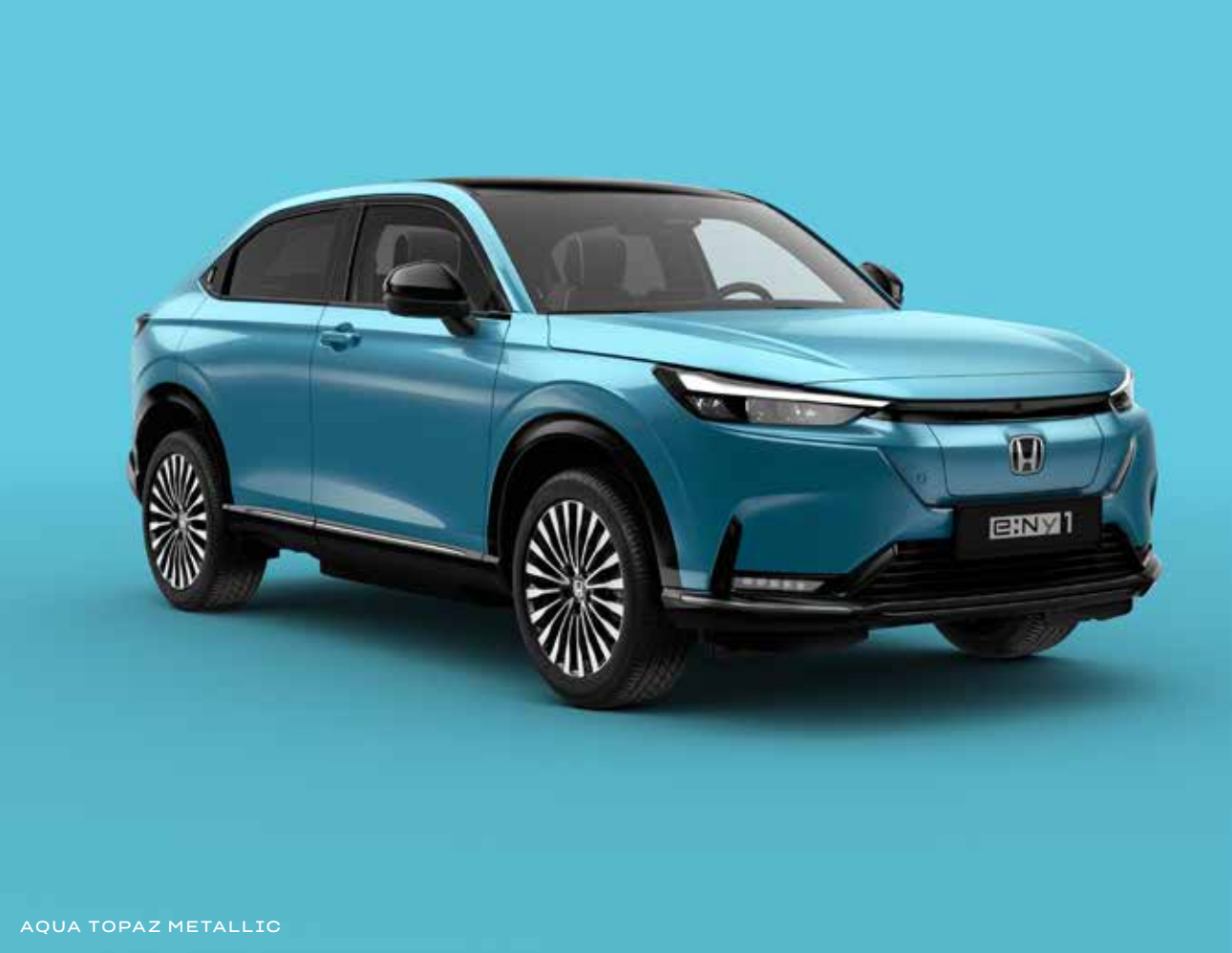
AQUA TOPAZ METALLIC

Velg mellom en rekke moderne farger som gjenspeiler personligheten din og den dynamiske designen til e:Ny1.