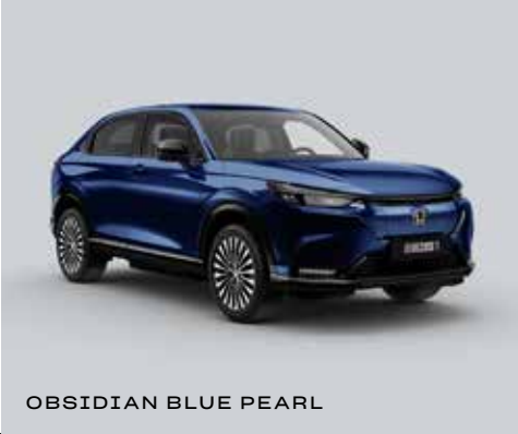
OBSIDIAN BLUE PEARL