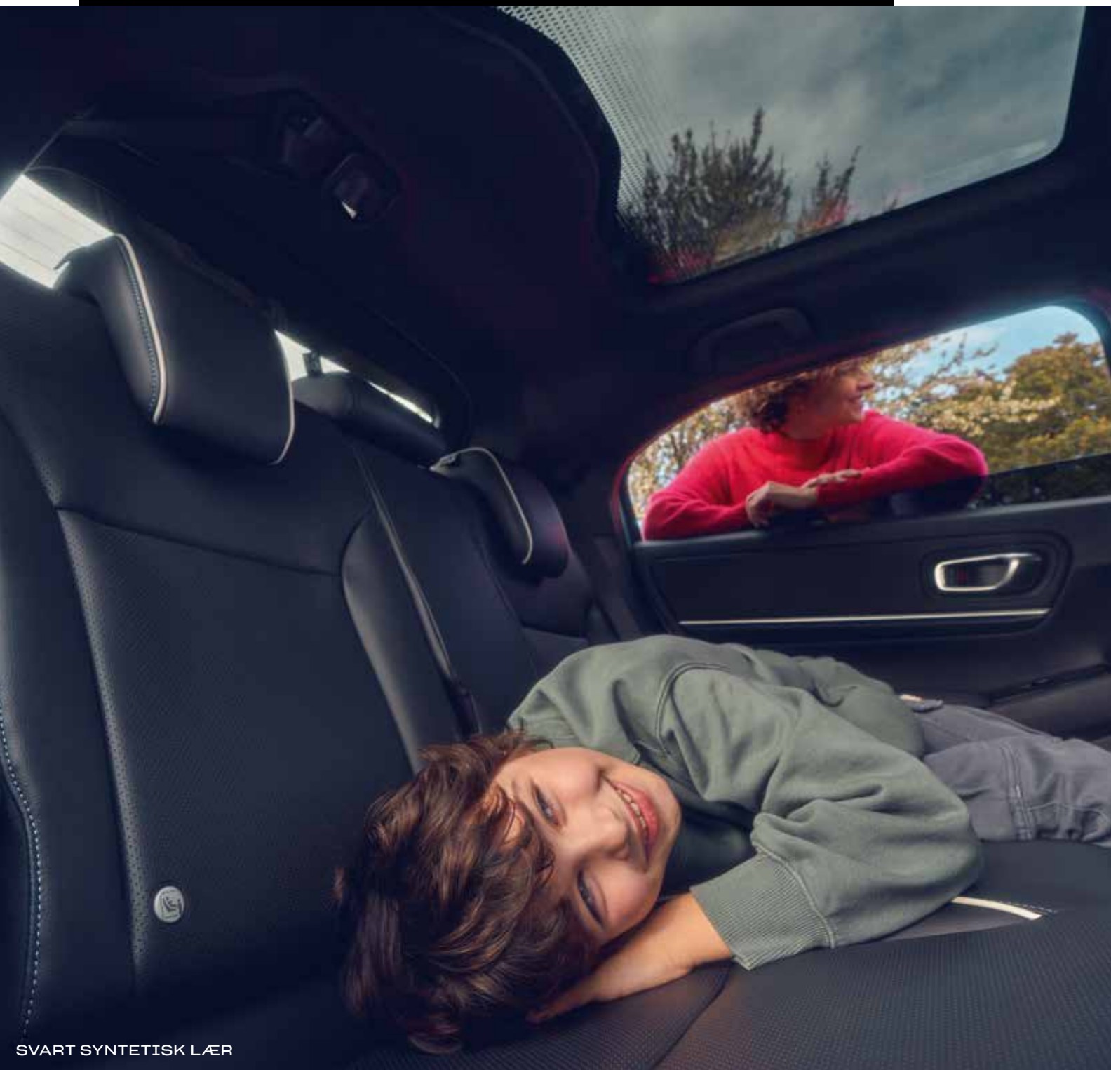
SVART SYNTETISK LÆR

*Kun på utvalgte utgaver og farger Bilen som vises er Honda e:Ny1 Advance i Aqua Topaz Metallic. Se side 52-55 for mer informasjon om modellutvalg, spesifikasjoner og funksjoner.