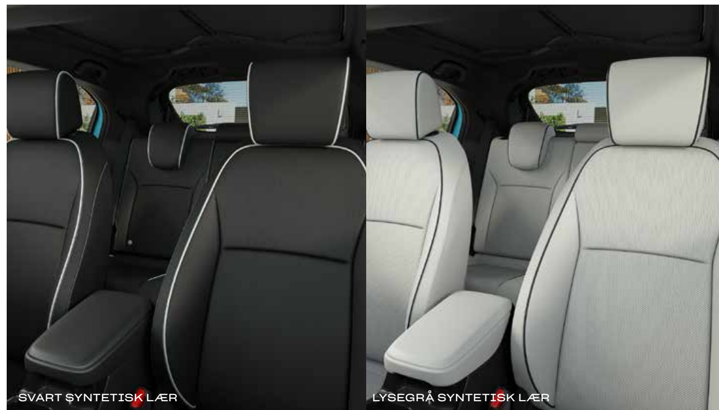
SVART SYNTETISK LÆR